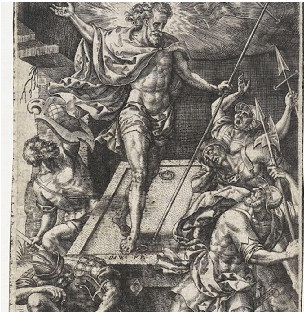
Johannes Wierix (mentioned on object), 1573 Christus verrijst uit zijn graf. De soldaten die rondom het graf liggen schrikken wakker en vluchten