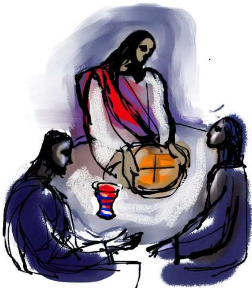
Brood uit de hemel