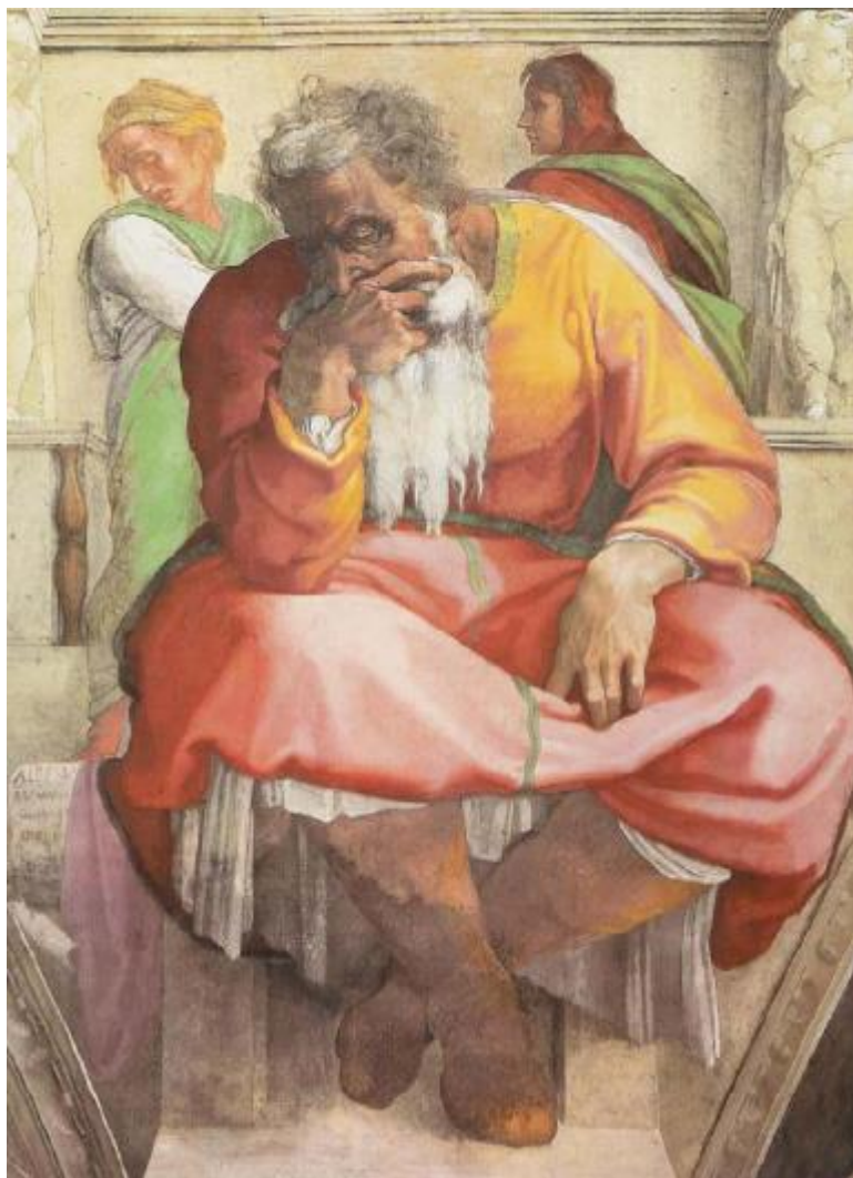
Jeremia als afgebeeld door Michelangelo.