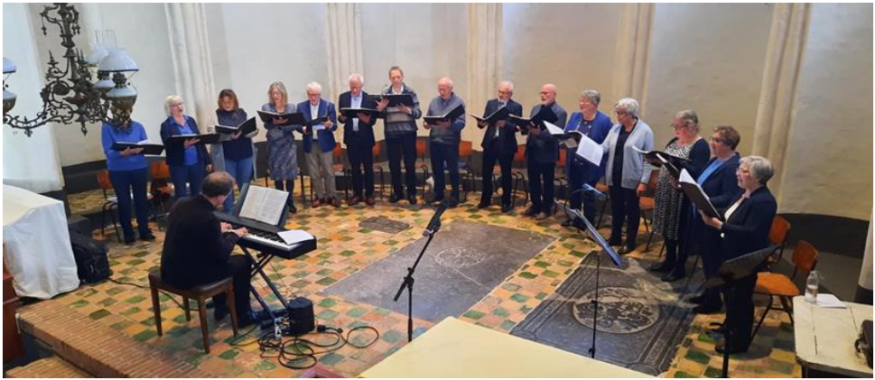
Foto: Kloosterkerk in Thesinge