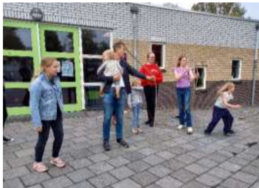
pijl en boog