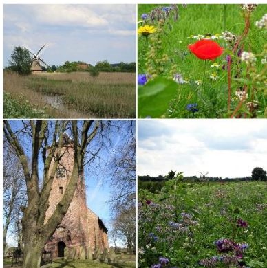
Rondje bij Noorddijk

Uiteraard mag je ook aanschuiven bij de werkgroep diaconie van Damsterboord (of een andere gemeente). Je mag altijd via e-mail contact opnemen: diaconie@damsterboord.nl