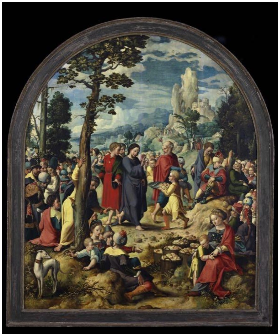
De wonderbaarlijke spijziging