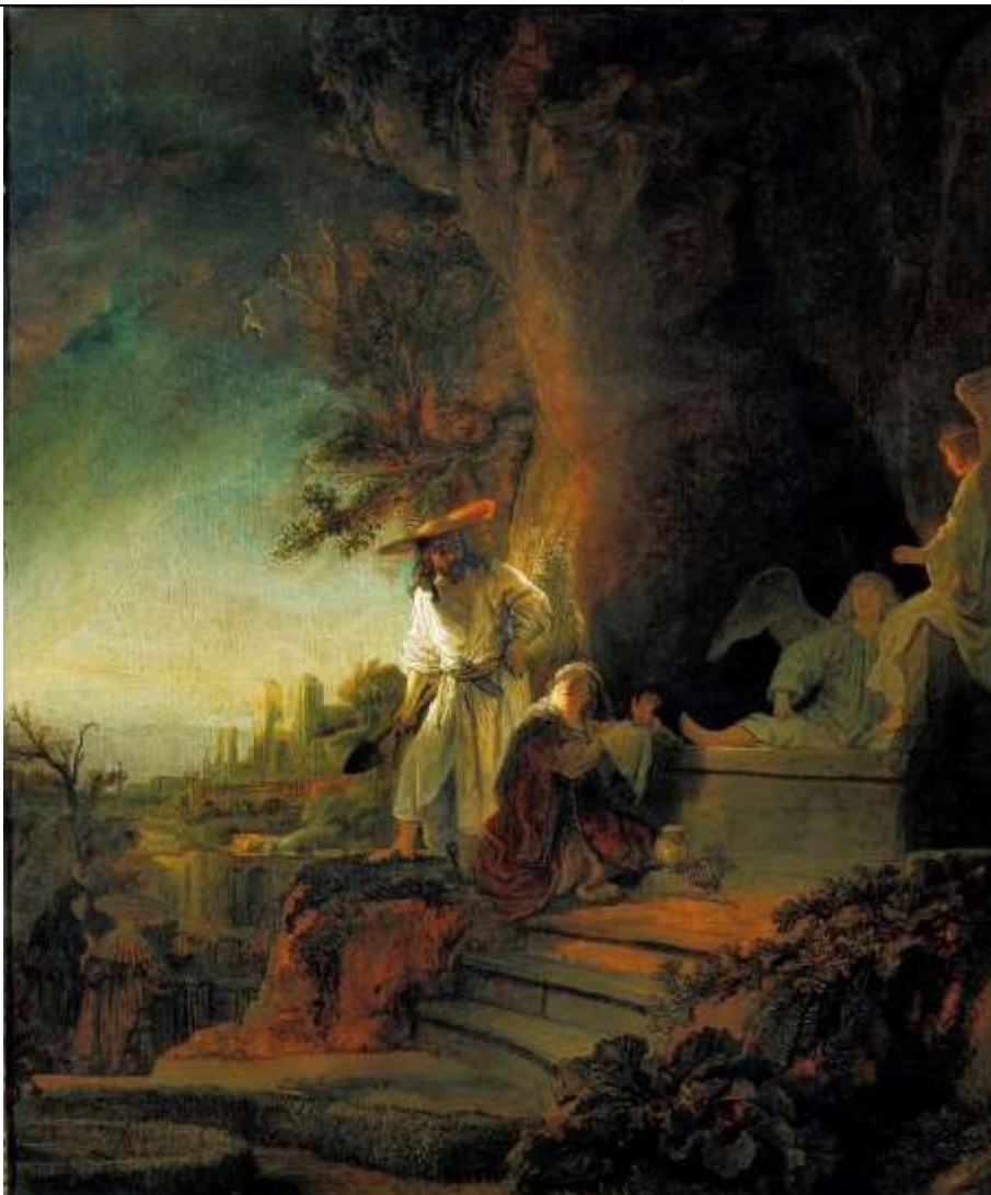
Christus verschijnt aan Maria Magdalena. Zie de overweging op pag. 4