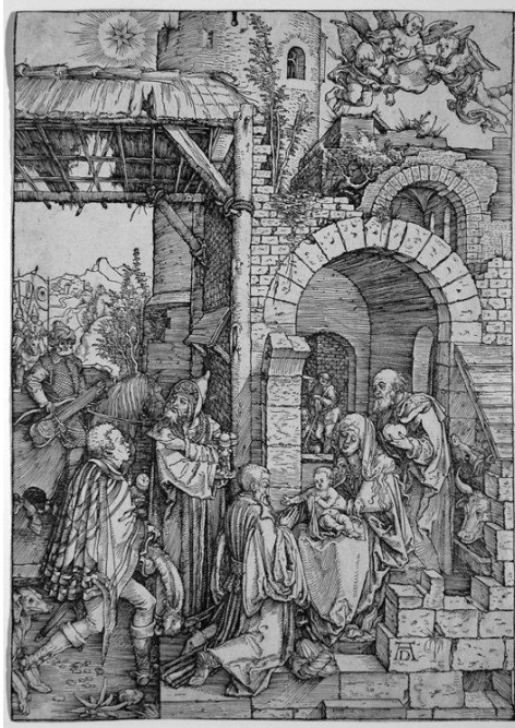
Dürer, aanbidding der wijzen (houtsnede)