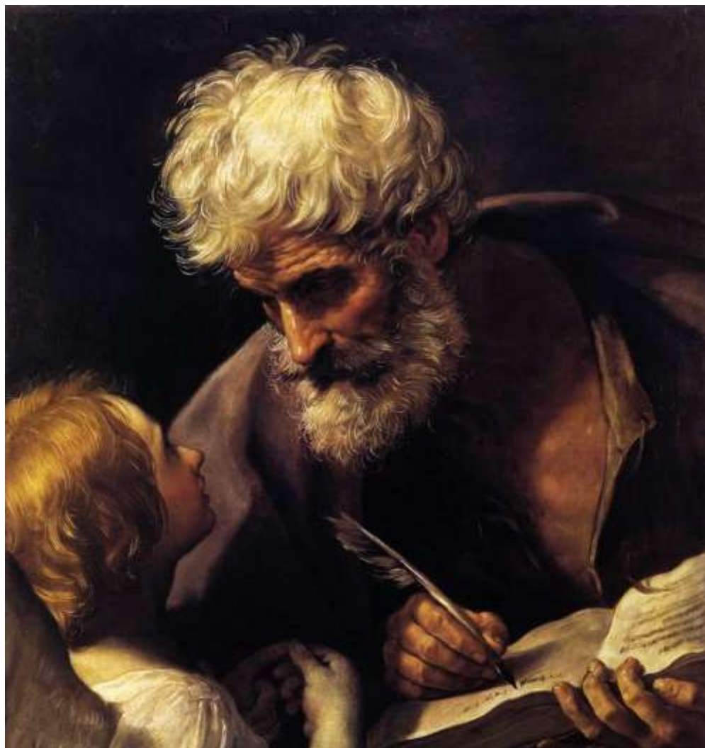
Mattheüs en de Engel - Guido Reni (1575-1642)